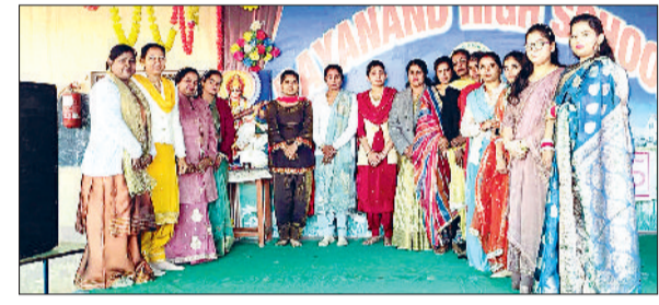
भडूकलां। विदाई समारोह का शुभारंभ करते अध्यापक।

समारोह के दौरान गीत, नृत्य एवं भावनात्मक संदेशों के माध्यम से 10वीं कक्षा के विद्यार्थियों के साथ बिताए गए यादगार पलों को साझा किया गया। विद्यालय परिवार की ओर से सभी छात्रों को आगामी बोर्ड परीक्षाओं के लिए शुभकामनाएं देते हुए सफलता की कामना की गई। कार्यक्रम को सफल बनाने में