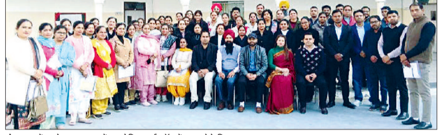
टोहाना। सेंट जोसफ स्कूल में आयोजित वर्कशॉप में भाग लेते शिक्षक।

भूना रोड स्थित सेंट जोसफ इंटरनेशनल स्कूल में सीबीएसई द्वारा आयोजित कैपेसिटी बिल्डिंग प्रोग्राम द हैप्पी क्लासरूम का सफल आयोजन किया गया। इस एकदिवसीय प्रशिक्षण कार्यक्रम का उद्देश्य शिक्षकों को ऐसे नवीन विचार, रणनीतियां और शिक्षण दृष्टिकोण प्रदान करना था, जिनसे कक्षा-कक्ष में विद्यार्थियों की खुशी, सहभागिता तथा समग्र विकास को बढ़ावा मिल सके, साथ ही शिक्षकों