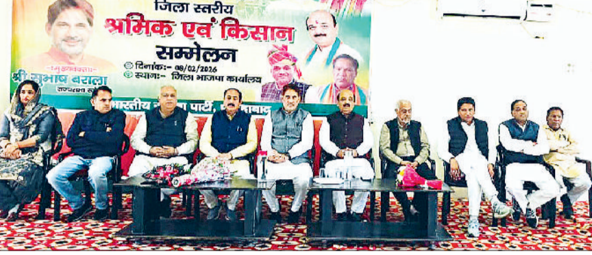
फतेहाबाद। जिला स्तरीय किसान श्रमिक सम्मेलन में मौजूद भाजपा नेता।