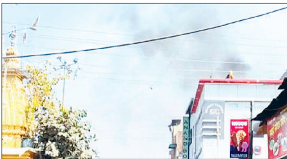
सिरसा। दुकान पर लगी आग से उठता धुआं।

शहर के शिव चौक क्षेत्र में रविवार दोपहर को दुकान में अचानक आग लग गई। आग लगने की घटना से आसपास के दुकानदारों और लोगों में अफरा-तफरी का माहौल बन गया। प्रत्यक्षदर्शियों के अनुसार दुकान की ऊपरी मंजिल से धुआं और लपटें उठती दिखाई दीं, जिसके बाद आसपास में मौजूद लोगों ने तुरंत आग बुझाने का प्रयास शुरू किया और फायर ब्रिगेड को सूचना दी। सूचना मिलते ही दमकल विभाग की टीम मौके पर पहुंची और