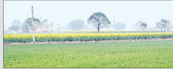
फतेहाबाद। खेतों में तेज धूप ने खड़ी गेहूं की फसल।

बरसात न होने से चना व सरसों की फसल काली पड़नी शुरू हो जाती है और उसकी बढवार रूक जाती है, जिसका सीधा असर उत्पादन पर पड़ता है। पीछे अच्छी धुंध ने बरसात का काम चलाया लेकिन अब तेज धूप धुकसानदायक साबित हो रही है। कृषि विशेषज्ञों का कहना है कि किसान अच्छी सिंचाई करें। पिछले 13 सालों में ऐसा पहली बार हुआ है कि दिसम्बर में एक बार भी बरसात नहीं हुई जबकि जनवरी में नाममात्र ही बरसात हुई।