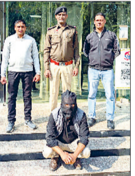
फतेहाबाद। धोखाधड़ी मामले में कोलकाता से पकड़ा गया युवक।

बताया कि नौ दिसंबर 2024 को उसके मोबाइल फोन पर एक लिंक आया। अज्ञात लिंक पर क्लिक करते ही एक एपीके फाइल उसके मोबाइल में डाउनलोड हो गई, जिसके बाद उसके एचडीएफसी बैंक क्रेडिट कार्ड से 75 हजार 900 रुपये निकाल लिए गए। इस संबंध में उसने पोर्टल पर शिकायत दर्ज करवाई थी। इस मामले में साइबर थाना फतेहाबाद पुलिस ने 22 अप्रैल 2025 को केस दर्ज किया और अब तक इस मामले में चार युवकों को गिरफ्तार किया जा चुका है। थाना प्रभारी के अनुसार मामले की जांच जारी है तथा अन्य संलिप्त व्यक्तियों की भूमिका भी खंगाली जा रही है।