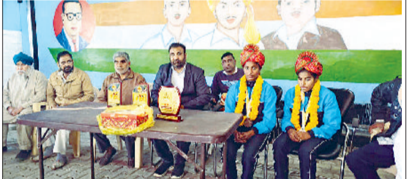
सिरसा। पदक विजेता बेटियों का सम्मान करते ग्रामीण।

नेशनल स्कूल प्रतियोगिता के अंडर-19 में अपना दमखम दिखा। बता दें कि सिरसा जिले से इन दोनों खिलाड़ियों ने प्रवेश टीम में भागीदारी की। इस टूर्नामेंट में हरियाणा ने कांस्य पदक जीता जिसमें इन दोनों निशा ने महत्वपूर्ण