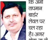
सिरसा। चुरापोस्त सहित पकड़ा गया आरोपी।